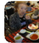
「はじめはいつもとは違う雰囲気でしたが、少し驚かれた方もいらっしゃいました。目の前のカウンター

は じめはいつもとは違う雰囲気でしたが、少し驚かれた方もいらっしゃいました。目の前のカウンター