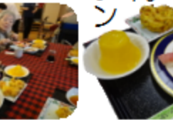
「リ ビングの入り口がお寿司屋さんのお寿司屋さんのカウンターにと様変わりして、昼食会が始まりました。」

リ ビングの入り口がお寿司屋さんのお寿司屋さんのカウンターにと様変わりして、昼食会が始まりました。