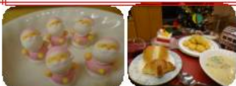
クリスマス忘年会