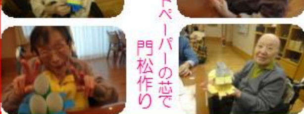
トイレットペーパーの芯で門松作り