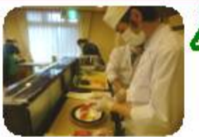
「少 前のお話です。毎年恒例となっているケータリング行事。前回、ご好評をいただいた『寿し花月』様に再びお越しいただき、お寿司のケータリングサービスを行いました。」

少 前のお話です。毎年恒例となっているケータリング行事。前回、ご好評をいただいた『寿し花月』様に再びお越しいただき、お寿司のケータリングサービスを行いました。