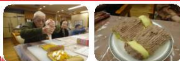
ブッシュ・ドノエル 甘くて美味しいケーキができました！

毎年のことながら12月は、行事が目白押しです。クリスマスツリーを飾り付けたり、ケーキ（今年はブッシュ・ド・ノエルでした）を作っておやつに食べたり、門松を作ったり、お餅をついたり・・・音楽教室では、サウンドアシストのお2人にご協力をいただき、有志職員によるクリスマスコンサートもありました。そうそう、忘れてはいけない！クリスマス忘年会でチキンナゲットの食べ放題やドルチェのお2人によるコンサートもあり、素敵なひとときを過ごしました。